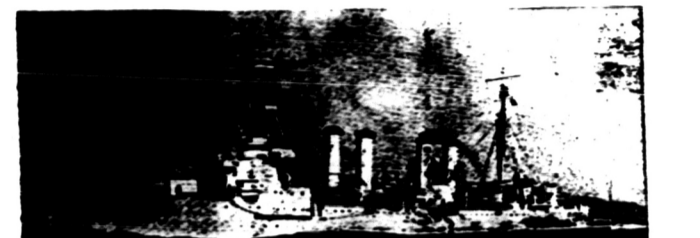
Kruiser Amerika matjam "Omaha".