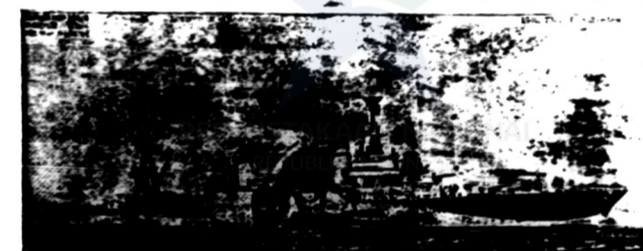
Slagschip Amerika matjam "Augusta".

Sebeloem penderjangan dalam moein poen - begitoehal ditentahoe oleh kalangan netral itoe, - tentara Roesia di Kaukasus soedah ditakar terdiri dari 15 divisi, tetapi sebagian besar telah dikirim keoetara. Diterangkan poela, bahwa angkatan laot Roesia telah terlepas dari kemoginnann akan menolok angkatan darat.